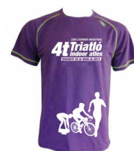
Molta sort, triatletes!

Aquesta prova, oberta a tota la ciutadania, és una plataforma per conèixer la disciplina del triatló i fomentar la pràctica d'aquest esport.