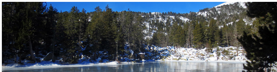
Estany de l'Orri

Nota important: Els socis de la UEC de Sants tindràn prioritat d'inscripció a la present excursió fins el dilluns 24 de gener. A partir d'aquest dia queda oberta a tothom. Al moment de l'inscripció haureu de facilitar un telèfon de contacte i el nombre del DNI per incloure-us a l'assegurança.