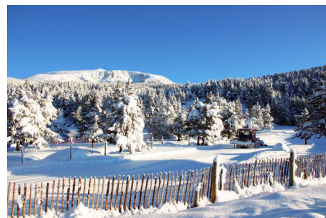
Cap de Rec